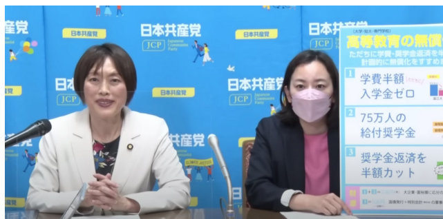
政策発表する田村智子政策委員長（左）と吉良よし子青年・学生委員会責任者=5日、国会内

政策は、負担能力を超えた高学費と貸与中心の奨学金制度のもと、学生の3人に1人が平均300万円の借金＝奨学金返済を背負っており、その総額は10兆円近くに上ると指摘。