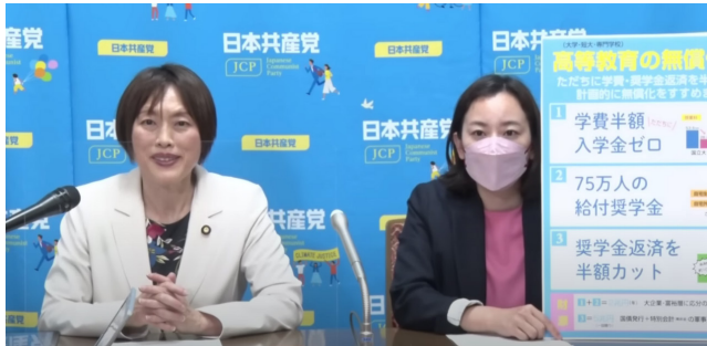
政策発表する田村智子政策委員長（左）と吉良よし子青年・学生委員会責任者=5日、国会内

政策は、負担能力を超えた高学費と貸与中心の奨学金制度のもと、学生の3人に1人が平均300万円の借金＝奨学金返済を背負っており、その総額は10兆円近くに上ると指摘。