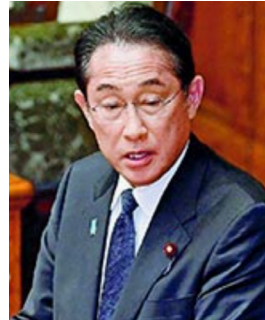
今国会で悪法を次つぎ強行した岸田文雄首相 5月24日・参院本会議

報道各社の世論調査（いずれも17、18両日実施）で岸田政権の支持率が軒並み低下しています。「異次元の少子化対策」と称して打ち出した「こども未来戦略方針」に「期待できない」との回答が多数を占めるなど、国民の不信が広がっています。