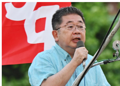
6月16日・池袋駅東口で訴える小池晃書記局長