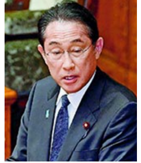
今国会で悪法を次つぎ強行した岸田文雄首相 5月24日・参院本会議

報道各社の世論調査（いずれも17、18両日実施）で岸田政権の支持率が軒並み低下しています。「異次元の少子化対策」と称して打ち出した「こども未来戦略方針」に「期待できない」との回答が多数を占めるなど、国民の不信が広がっています。