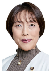
田村 智子 委員長・参院議員