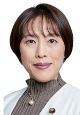
田村 智子 党委員長・参院議員