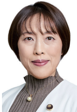
田村 智子 党委員長・参院議員