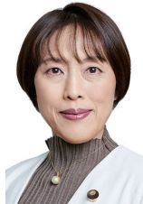
田村 智子 党委員長・参院議員