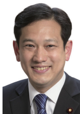
宮本 徹 衆議院議員