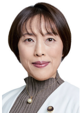
田村 智子 党委員長・参院議員