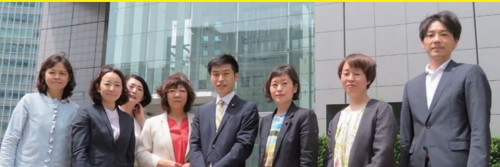
▲ 吉良よし子、山添拓参院議員と党都議団でJR 東日本への申し入れ

私たちは2021年、痴漢被害実態調査のアンケートに取り組み、国会、都議会での質問や、鉄道会社への申し入れなど「痴漢ゼロ」を政治の課題にするためにとりくんできました。